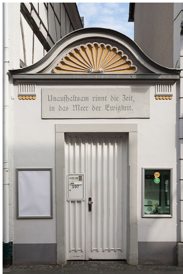
Das Eingangstor des "Cahnschen Hauses", der 1933 abgebrochenen jüdischen Synagoge; heute als Verbindungsmauer zwischen den Häusern in der Königswinterer Hauptstraße 395 und 397a erhalten (2013).