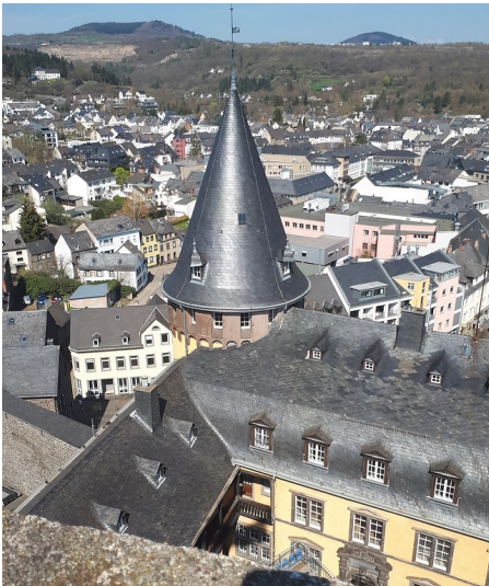
Blick über die Stadt Mayen, links im Hintergrund der Berg Hochsimmer, davor ein Steinbergwerk (2019).