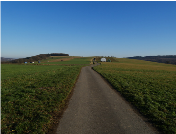
Geteerte Trasse der ehemaligen Römerstraße Ausoniusweg im Soonwald (2016)