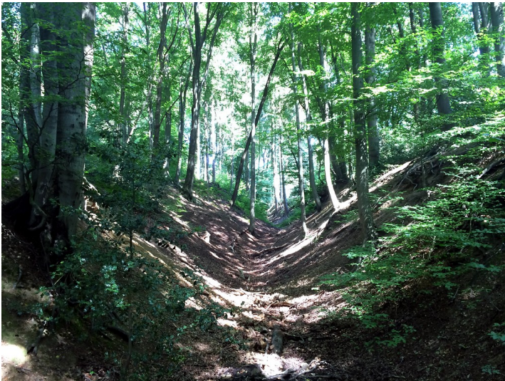
Hohlwege Pohler Berg in Kürten (2016)