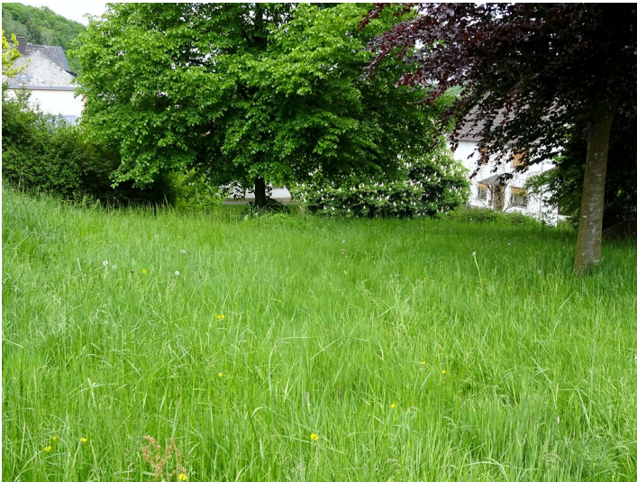
Ehemaliger Friedhof in Kastel (Nonnweiler) (2016)