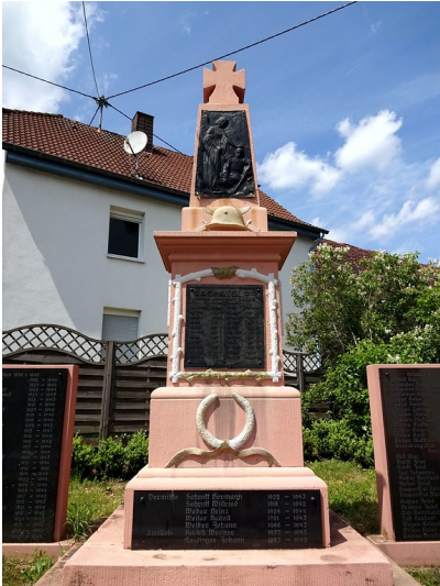
Kriegerdenkmal in Kastel (Nonnweiler) (2016)