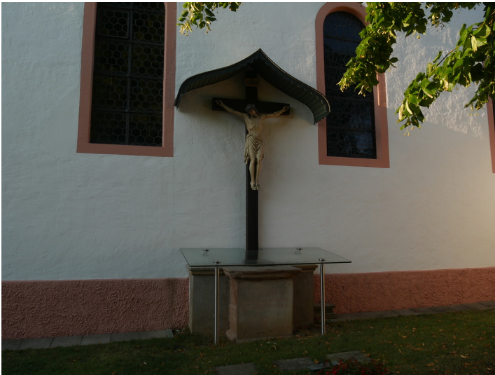
Holzkreuz der Pastorgedenkstätte in Dörrebach (2016)