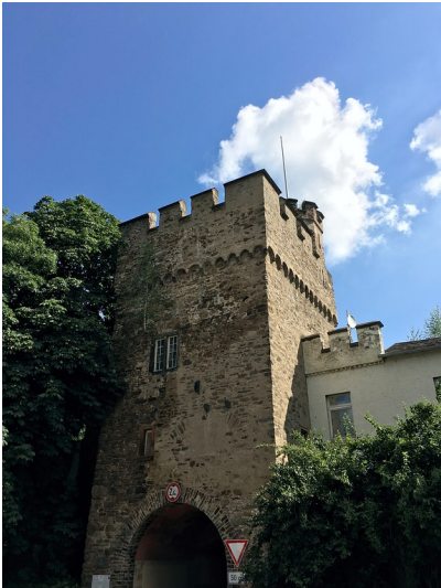
Kihrstor in Oberlahnstein (2016)