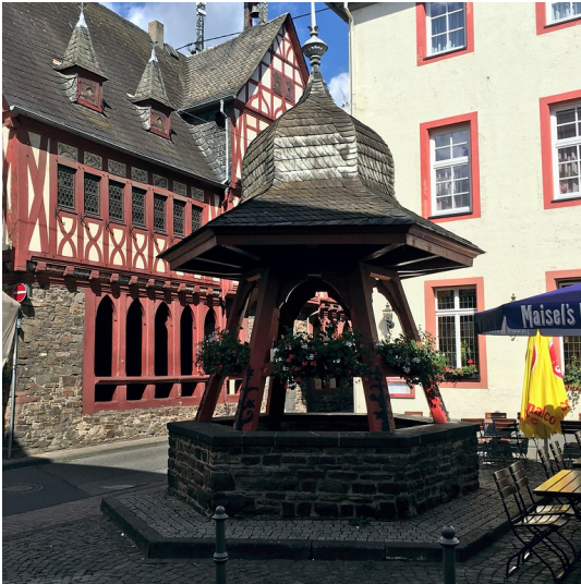
Ziehbrunnen in Oberlahnstein (2016)