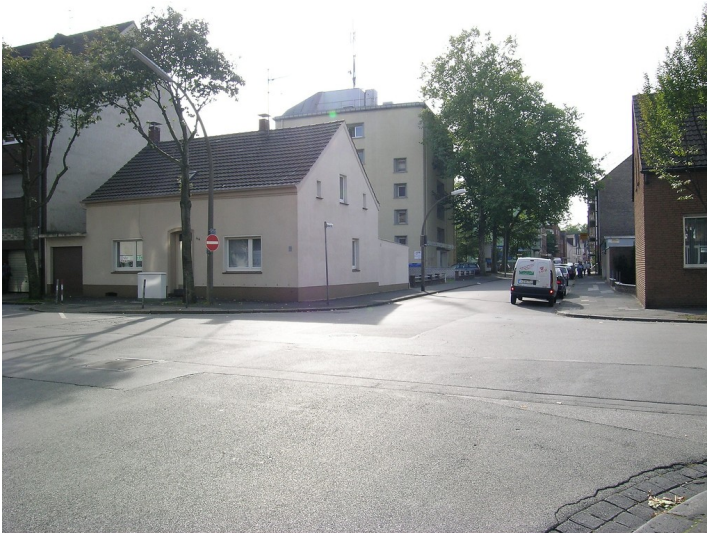
Hochbunker in der Günterstraße in Duisburg- Rheinhausen (2016)