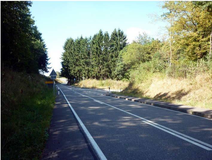
Die Dörrebach nach Argenthal verlaufende L 242 (2016)