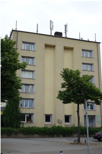
Hochbunker am Markt in Duisburg-Friemersheim (2016)