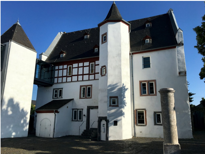
Nassau-Sporckenburger Hof in Niederlahnstein (2016)