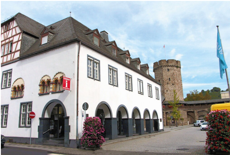
Salhof mit Hexenturm