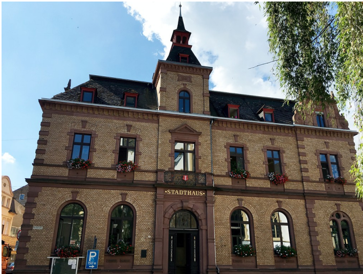
Rathaus in Oberlahnstein (2016).