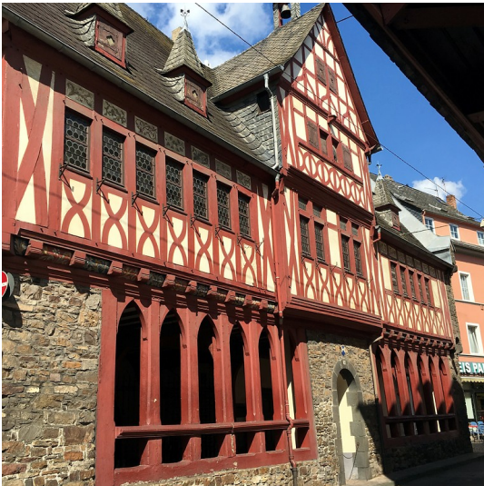
Altes Rathaus in Oberlahnstein (2016)