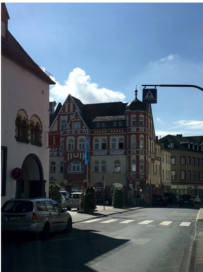
Gasthof Kaiserhof in Oberlahnstein (2016)