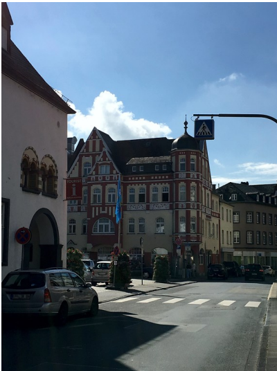
Gasthof Kaiserhof in Oberlahnstein (2016)