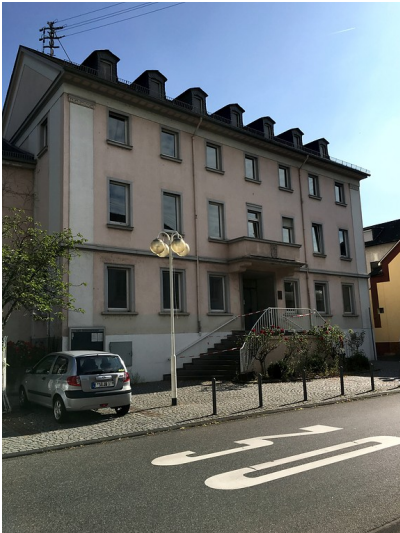
Altes Rathaus in Niederlahnstein (2016)