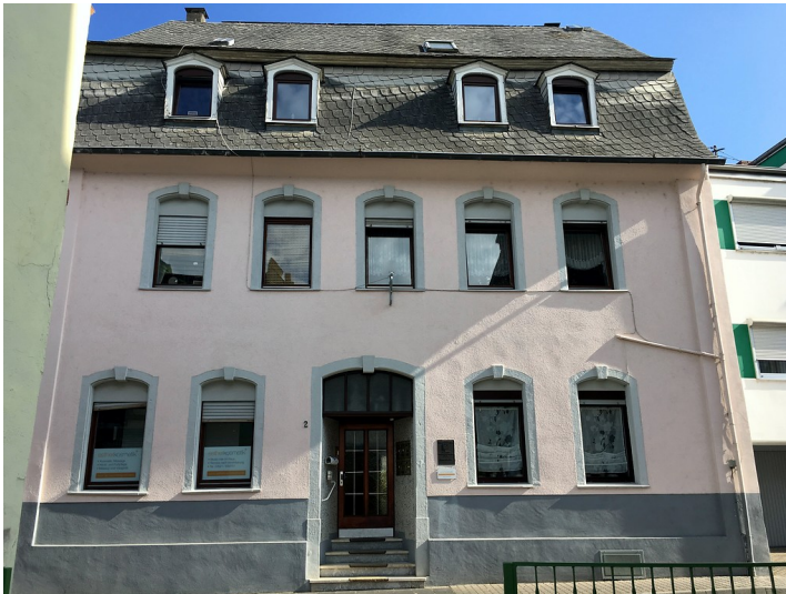
Zehnthof der Kurfürsten von Trier in Lahnstein (2016)