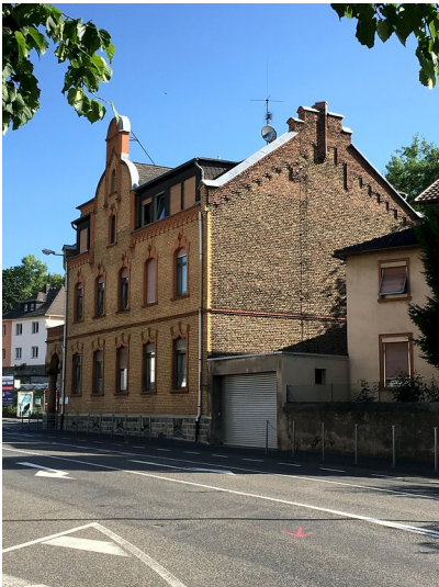
Seitenansicht des Postamts in Niederlahnstein (2016)