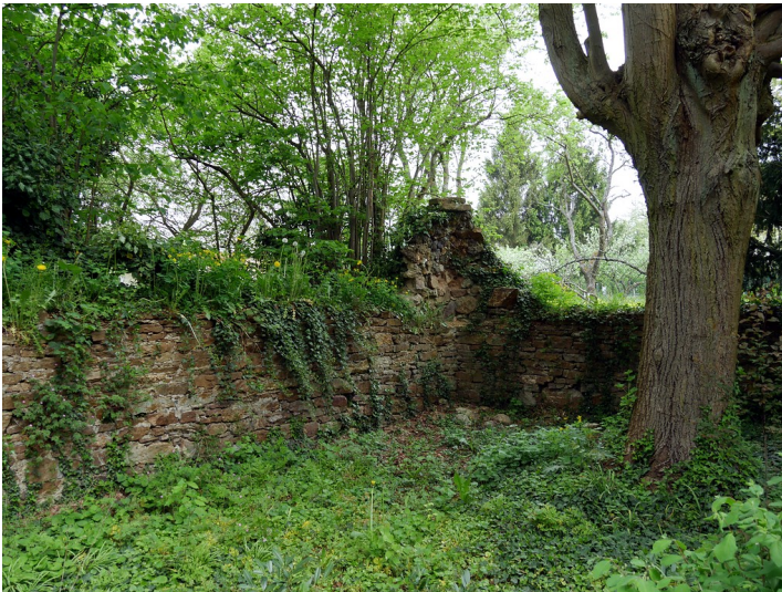
Mauerreste des ehemaligen katholischen Friedhofs in Dörrebach (2016).