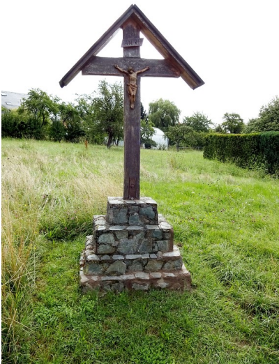
Prozessionskreuz in Dörrebach (2016)