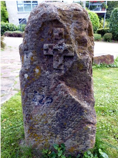
Dörrebacher Wappen auf dem ehemaligen Grenzstein der Forstreviere Dörrebach und Schöneberg