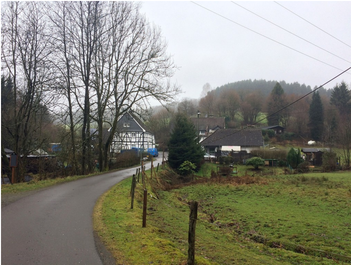
Weiler Hommermühle in Kürten (2016)