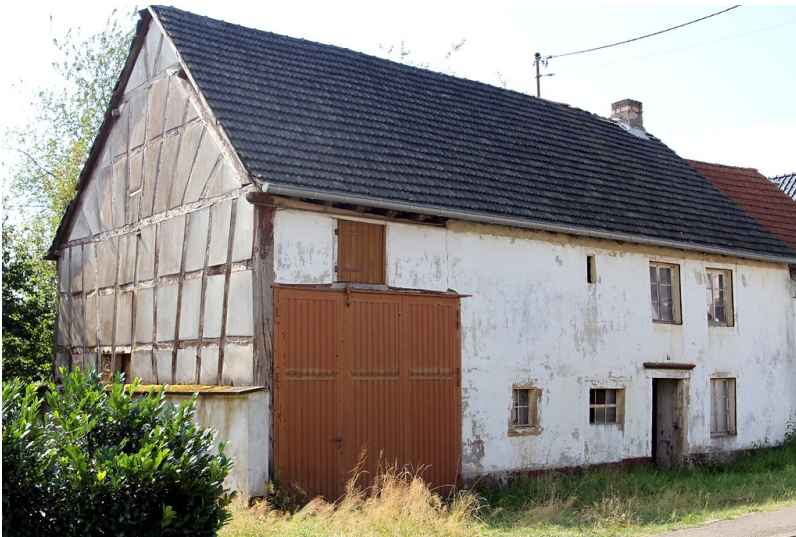
Frontansicht des alten Fachwerkhauses im Mühlenweg 8 in Nonnweiler (2016)