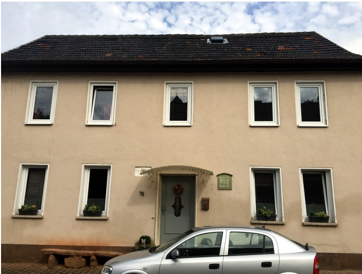
Frontansicht des Bann-Backhauses in Bad Münster am Stein-Ebernburg (2016).