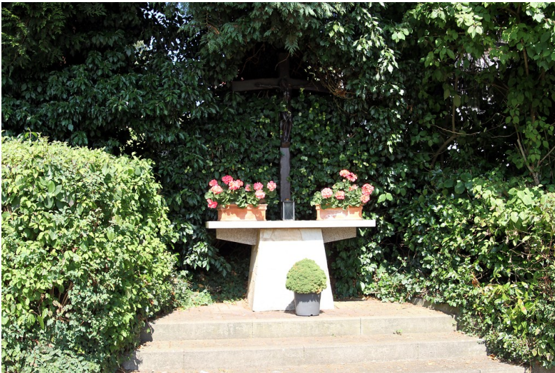
Kreuz an der Ecke Alte Holh und Brunnenstraße in Otzenhausen (2016)