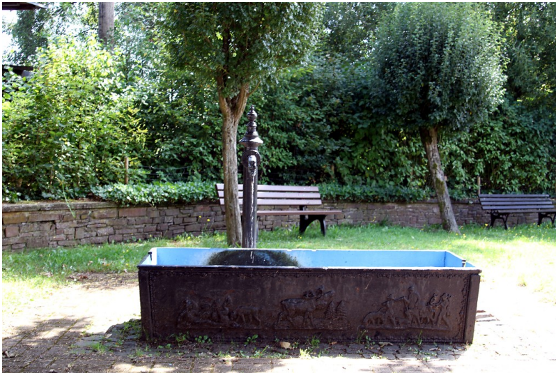
Frontansicht des Brunnens in der Brunnenstraße in Otzenhausen (2016)