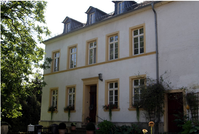
Wohnteil des alten Bauernhauses in Otzenhausen (2016)