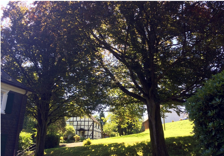
Naturdenkmal Rotbuche und Blutbuche in Kürten-Delling (2016)