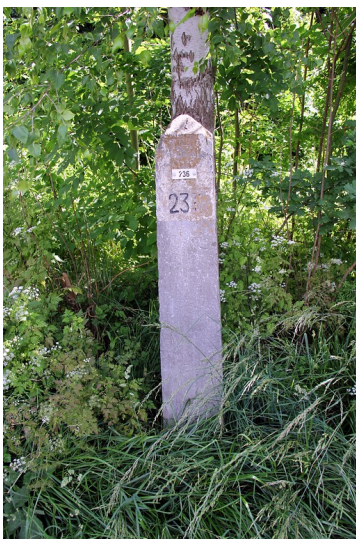
Niederländischer Grenzstein 236 der deutsch-niederländischen Grenze zwischen Kerkrade und Herzogenrath (2016)