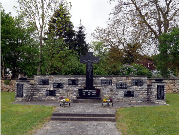
Kriegerdenkmal auf dem Friedhof in Dörrebach: Denkmal für die Gefallenen beider Weltkriege (2016).