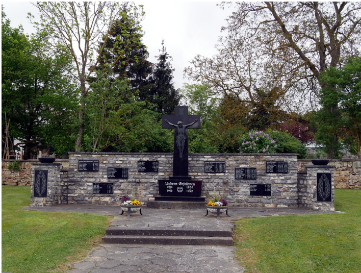
Kriegerdenkmal auf dem Friedhof in Dörrebach: Denkmal für die Gefallenen beider Weltkriege (2016).