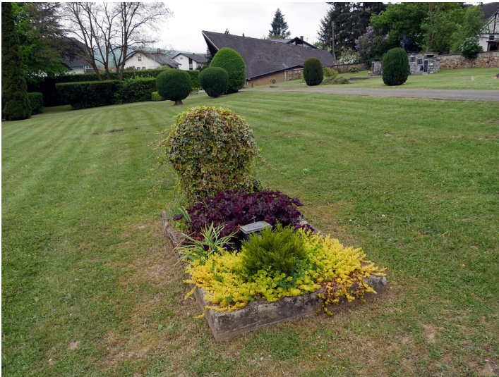
Frontansicht des Grabmals des unbekannten Soldaten auf dem Friedhof von Dörrebach (2016).