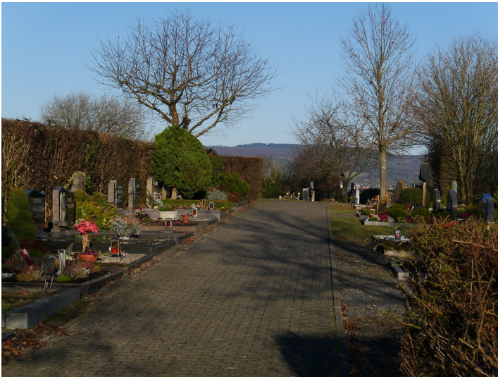
Eingangsbereich des Friedhofs Dörrebach (2016)