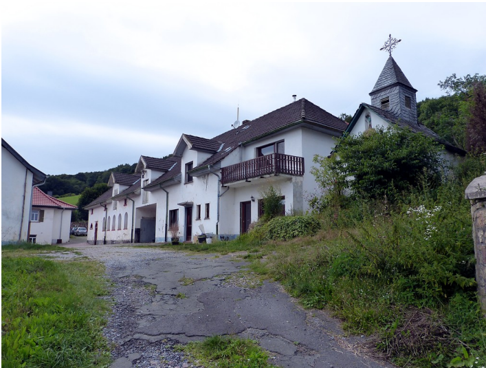
Oberer Weinbergerhof bei Dörrebach (2016)