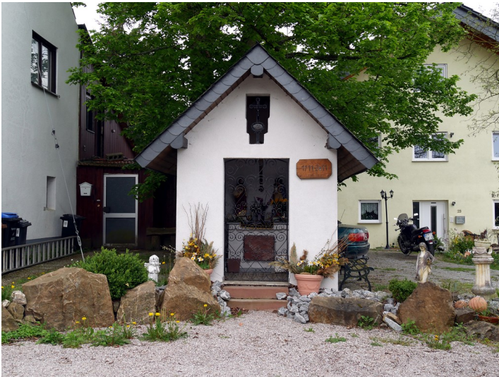
Frontansicht der Herz-Jesu-Kapelle in Dörrebach (2016).