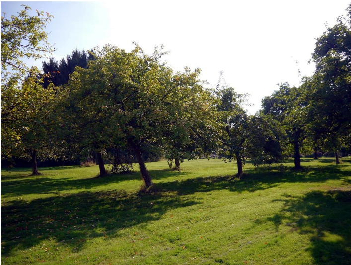
Streuobstwiese bei Waltenrath in Leichlingen (2016)