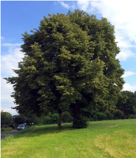
Naturdenkmal Winterlinde bei Rappenhohn in Overath (2016)