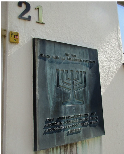
Gedenktafel zur ehemaligen Synagoge Ruhrort, dem früheren Bethaus in der Landwehrstraße (2016).