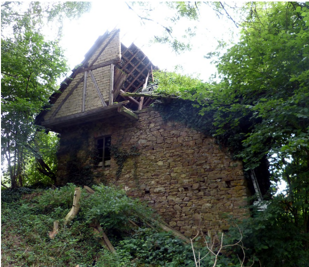
Seitenansicht der alten Lehmühle bei Schöneberg (2016)