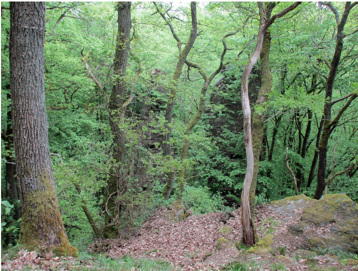
Die versteckt gelegene Burgruine Suitbertstein im Wald bei Dörrebach (Mai 2016).