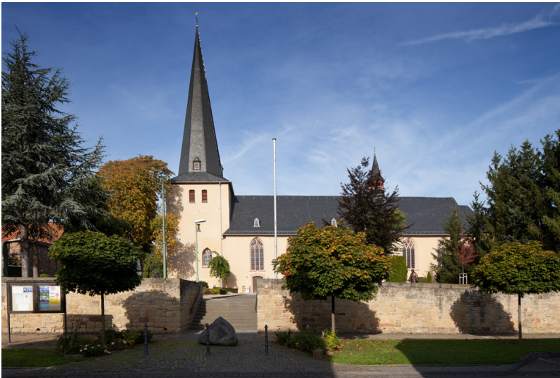
Zülpich-Bürvenich, Pfarrkirche St. Stephani Auffindung (2016)