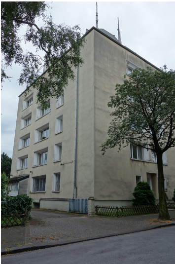
Hochbunker in der Kronenstrasse in Rheinhausen (2016)