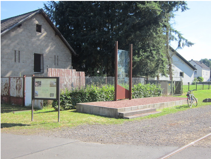
Synagogenstandort in Hellenthal-Blumenthal, Blick auf die Gedenkstätte (2016).