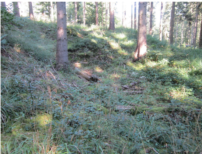
Bergbaugelände in Kall-Golbach. Blick auf einen Doppelschacht (2016)