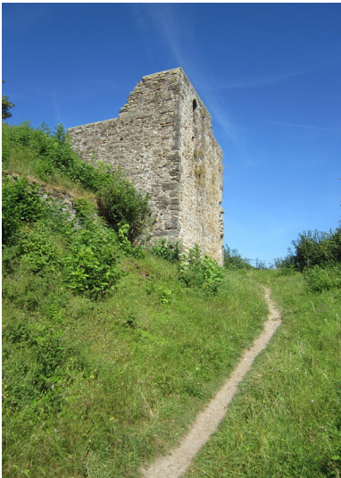
Burg in Dahlem-Kronenburg. Blick auf den ehemaligen Palas (Hauptgebäude) (2016)