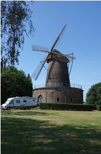
Windmühle in Rheinhausen-Bergheim (2016)