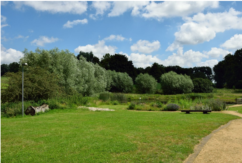
Kopfweiden am Wahrsmannshof (2016)