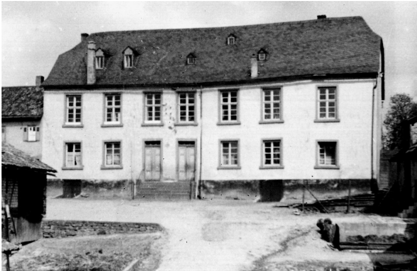
Ansicht des alten Schlosses in Dörrebach (um 1920)